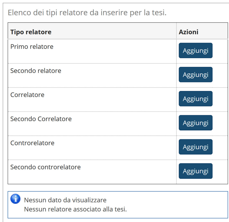
Fig. 9 – Inserimento dei relatori

Verificare i relatori indicati per la tesi.